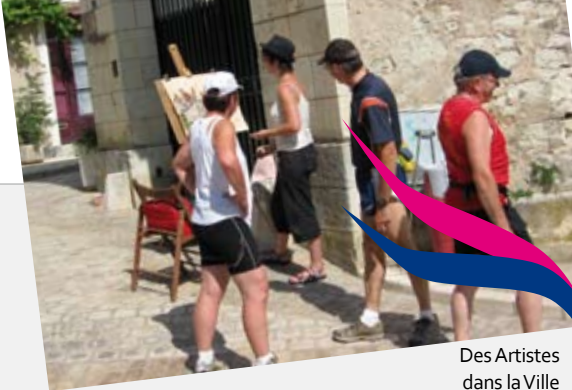
Des Artistes dans la Ville