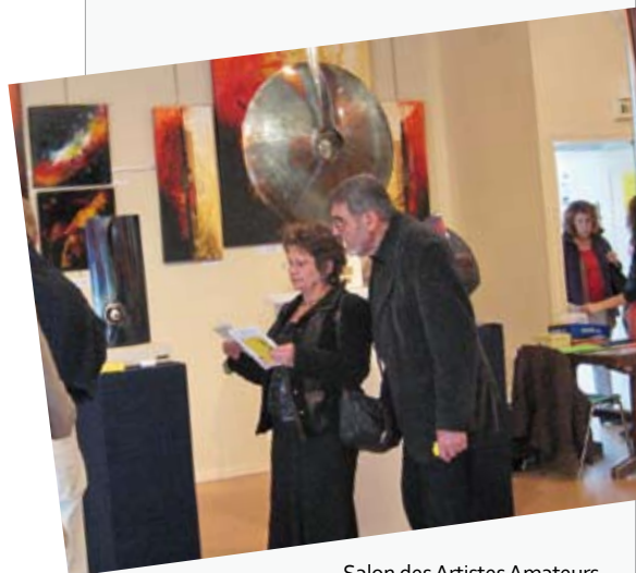
Salon des Artistes Amateurs